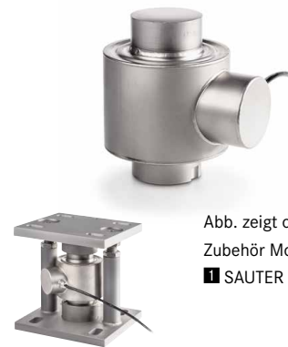
Abb. zeigt optionales Zubehör Montagekit ■ SAUTER CE P41430